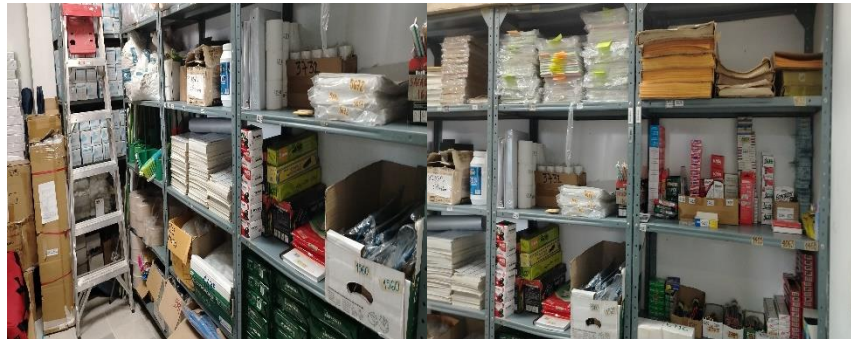
Fotos: almacén sede actual Dirección Territorial Atlántico

Se realizó muestreo aleatorio de los elementos de consumo en la bodega – almacén, de la Dirección Territorial de Meta con el acompañamiento del almacenista (contratista), en concordancia, con los registros en el sistema del Instituto, respecto a lo elementos físicos, evidenciando coherencia en las cantidades; se observaron elementos en estivas y cajas de cartón, algunos objetos sin identificar, al igual que, productos vencidos como tóner para impresoras.