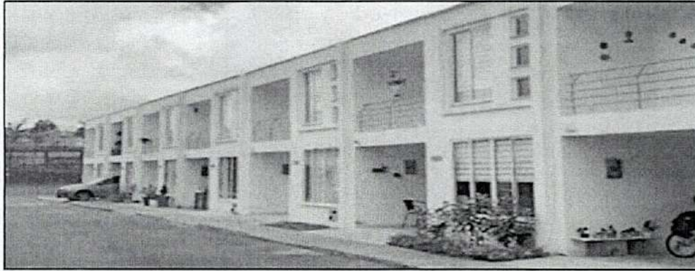
Imagen 2. Estructura homogénea asimilada para el predio 63-190-01-01-00-00-0419-0023-0-00-0000