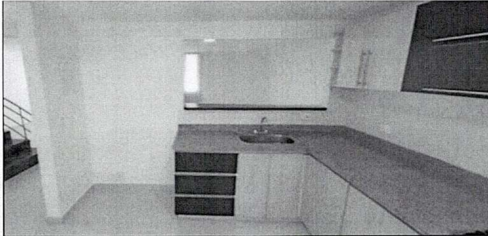
Imagen 5. Cocina homogénea asimilada para el predio 63-190-01-01-00-00-0419-0023-0-00-00-0000