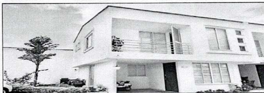
Imagen 1. Fachada homogénea asimilada para el predio 63-190-01-01-00-00-0419-0023-0-00-00-0000

En las Imágenes del 1 al 5 se presentan los registros fotográficos tomados en campo por el funcionario delgado de la Dirección de Gestión Catastral, al predio homogéneo 63-190-01-01-00-00-0429-0002-0-00-00-0000 para la calificación, de la Urbanización Parque Residencial Cantabria: