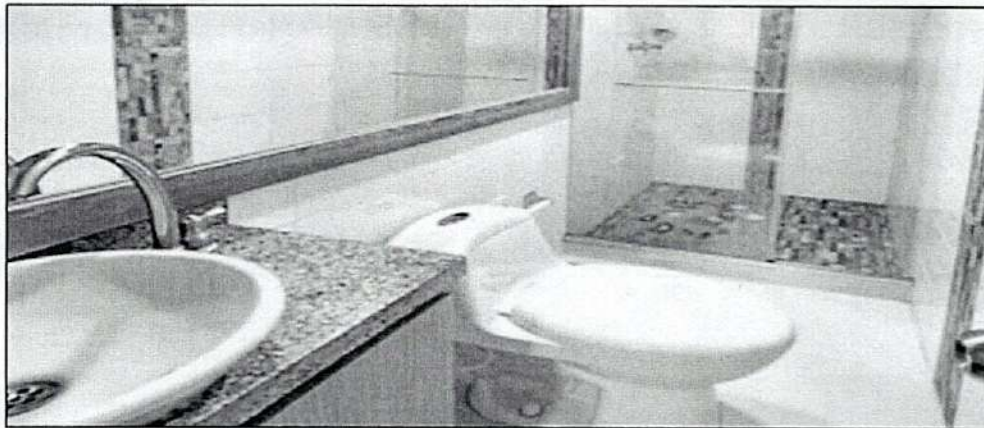
Imagen 4. Baño homogéneo asimilado para el predio 63-190-01-01-00-00-0419-0023-0-00-00-0000