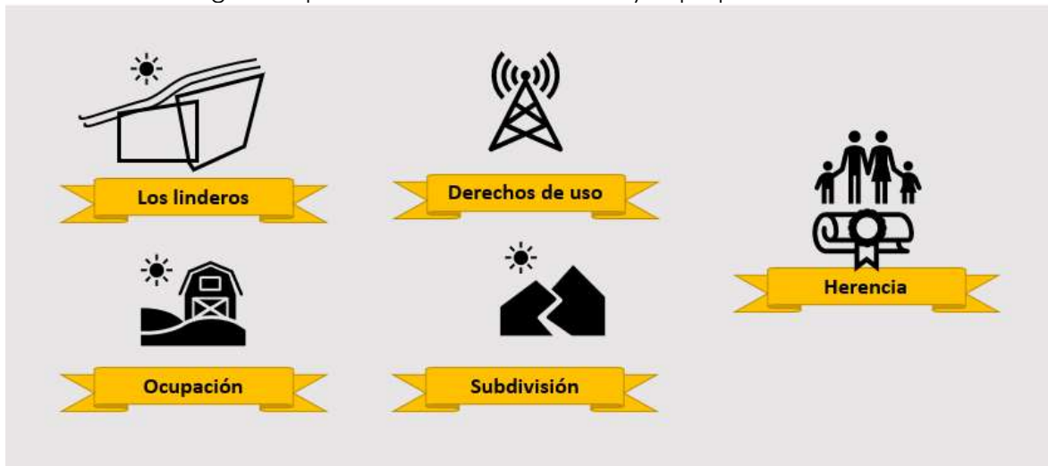
Figura1. Tipos de conflicto de la tierra y la propiedad inmueble