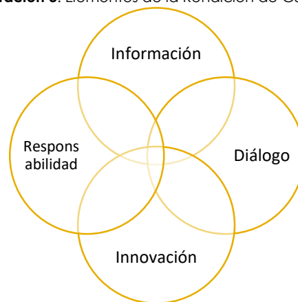
Ilustración 3. Elementos de la Rendición de Cuentas

Innovación: da cuenta de un elemento transversal que orienta la configuración de ejercicios de rendición de cuentas contemplando la perspectiva y experiencia de usuario de la ciudadanía, atendiendo ejercicios de caracterización y apropiación de herramientas y metodologías de ideación, co-diseño, coproducción, co-creación, prototipado, etc.