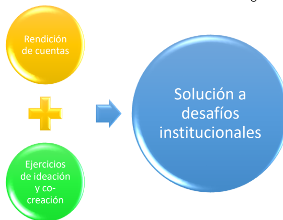
Ilustración 1. Modelo de rendición de cuentas del Instituto Geográfico Agustín Codazzi

Esto significa que el IGAC adelanta ejercicios de rendición de cuentas al tiempo que ejecuta esquemas de ideación y cocreación para la formulación conjunta de soluciones y alternativas a desafíos institucionales. La evaluación ciudadana en ejercicios de rendición de cuentas incluye entonces acciones de diagnóstico y formulación participativa.